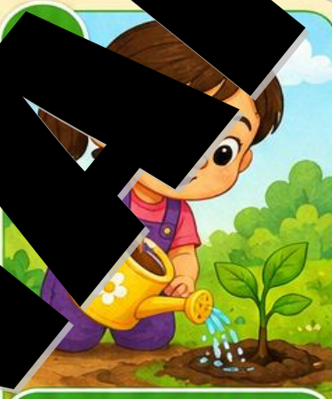
2. Me'yorida quyamiz