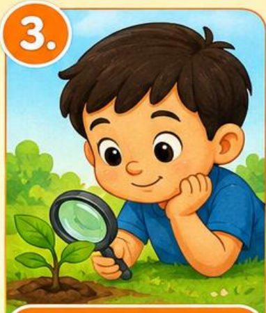
3. Har kuni kuzatamiz