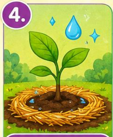
4. Namlikni saqlaymiz