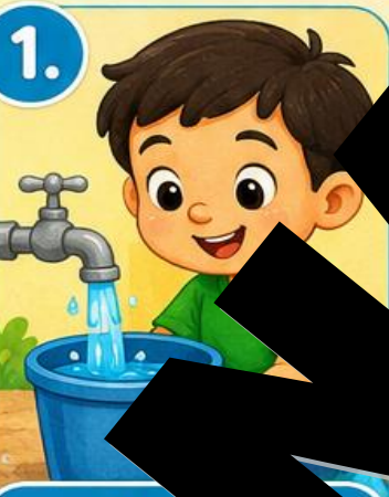
1. Suvi tayyorlaymiz