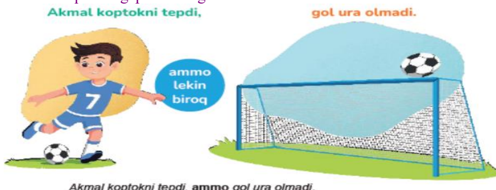
Akmal koptokni tepdi, ammo gol ura olmadi.

Zidlov bog‘lovchilarini qo‘llab gaplar tuzing.