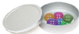
6 ta tugma