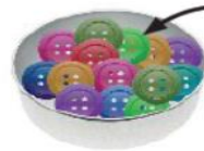
14 ta tugma