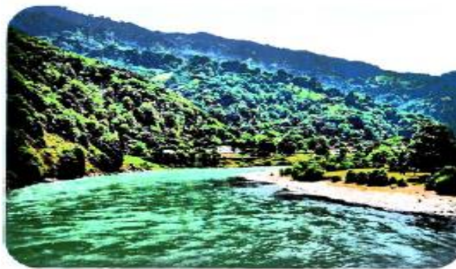
Chalbash daryosi, Gruziya

“Abadiyat qonuni” asari asosida o‘zbek tilida telespektakl ham yaratilgan. Nodar Dumbadzening tashabbusi bilan Gruziya poytaxti Tbilisi shahrida “Mziuri”- “Quyoshjon” nomli bolalar bog‘i bunyod etilgan. Ijodkor 1984-yil vafot etgan. Aziz o‘quvchilar, siz bilan “Hellados” hikoyasini o‘qishni boshlaymiz. Asar voqealari Venetsian ko‘chasining “sardori” Yanguli va tibilisilik Jamol atrofida kechadi... Mutolaadan