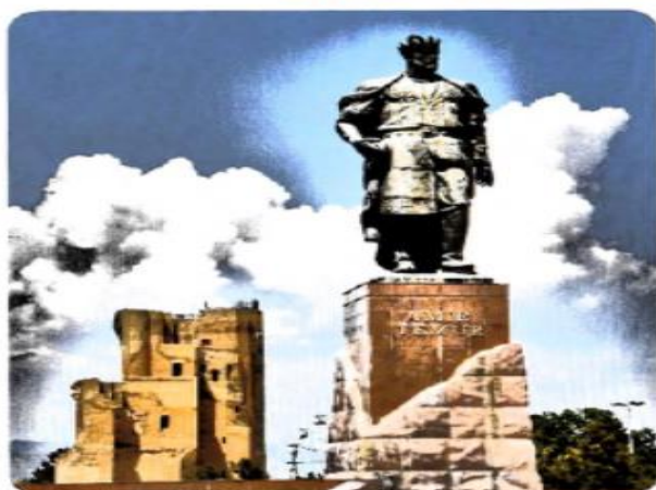
Amir Temur monumental san’at yodgorligi, Shahrisabz. Ilhom Jabborov