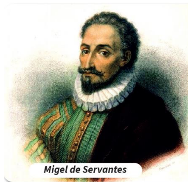
Migel de Servantes

VI. Uyga vazifani e‘lon qilish: yangi mavzuni to‘liq takrorlash va yangi mavzu yuzasidan bilimlarini mustaxkamlab kelish.