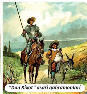
“Don Kixot” asari qahramonlari