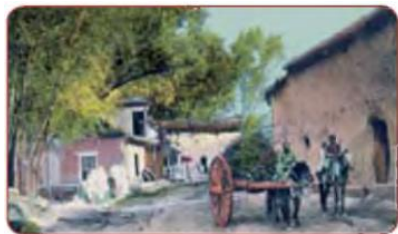
Toshkent. Eski shahar. XIX asr

1864-yil 1-oktabrida M. Chernyayev o‘zini podshoga yaxshi ko‘rsatish uchun tezlik bilan Toshkentni qo‘lga kiritmoqchi bo‘ldi. Lekin uning bu rejasi amalga oshmadi. M. Chernyayev 70 nafardan ziyod askarlaridan ajralib, Chimkentga chekinishga majbur bo‘ldi. Uning Toshkentni egallash uchun olib borgan birinchi harakati natija bermagach, yangi hujumga tayyorgarlik boshladi. Uning bu tayyorgarligi bahorgacha davom etdi va 1865-yil aprel oyi oxirida podsho hukumatining harbiy qo‘shinlari Toshkent yaqiniga joylashtirildi. M.Chernyayev boshchiligidagi harbiy qo‘shin Toshkent shahridan 25 km uzoqlikdagi Chirchiq daryosining chap sohilida joylashgan Niyozbek qal‘asiga kelib, uni jangsiz topshirishni taklif qiladi, lekin qal‘a himoyachilari rad javobini berib, mudofaaga o‘tadi.