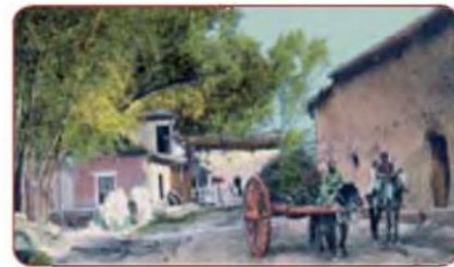
Toshkent. Eski shahar. XIX asr