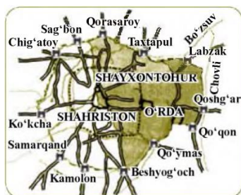
Eski shahar xaritasi. XIX asr