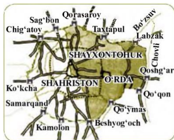
Eski shahar xaritasi. XIX asr