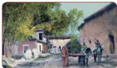
Toshkent. Eski shahar. XIX asr

1864-yil 1-oktabrida M. Chernyayev o‘zini podshoga yaxshi ko‘rsatish uchun tezlik bilan Toshkentni qo‘lga kiritmoqchi bo‘ldi. Lekin uning bu rejasi amalga oshmadi. M. Chernyayev 70 nafardan ziyod askarlaridan ajralib, Chimkentga chekinishga majbur bo‘ldi. Uning Toshkentni egallash uchun olib borgan birinchi harakati natija bermagach, yangi hujumga tayyorgarlik boshladi. Uning bu tayyorgarligi bahorgacha davom etdi va 1865-yil aprel oyi oxirida podsho hukumatining harbiy qo‘shinlari Toshkent yaqiniga joylashtirildi. M.Chernyayev boshchiligidagi harbiy qo‘shin Toshkent shahridan 25 km uzoqlikdagi Chirchiq daryosining chap sohilida joylashgan Niyozbek qal‘asiga kelib, uni jangsiz topshirishni taklif qiladi, lekin qal‘a himoyachilari rad javobini berib, mudofaaga o‘tadi.