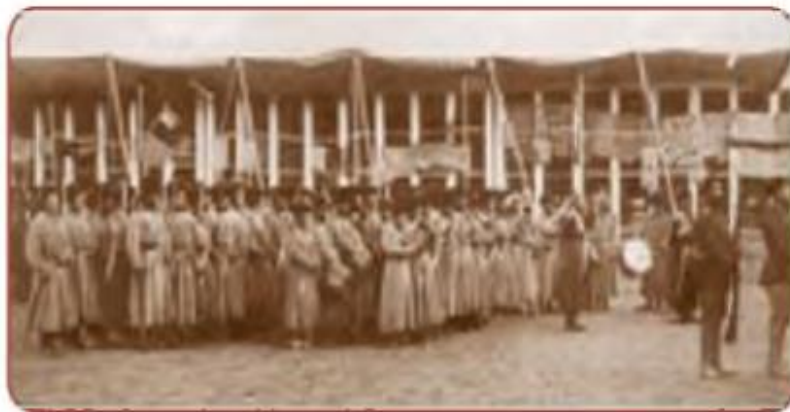
Buxoro harbiy qo‘shinlari

VI. Uyga vazifani e‘lon qilish: Xaritadan 1864-1866-yillarda bosib olingan hududlarni ko‘rsating