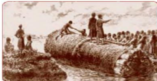
To‘g‘on qurilishi. XIX asr oxiri