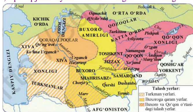
XIX asr o‘rtalarida O‘rta Osiyo davlatlari xaritasi

VI. Uyga vazifani e‘lon qilish: Darslikdagi 6-betdagi xaritadan foydalanib, quyidagi jadvalni to‘ldiring. Xonliklarga tegishli hududlarni ajratib yozing.