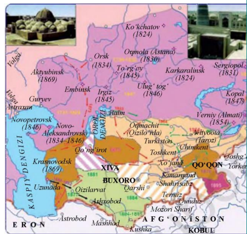
O‘rta Osiyo XIX asr oxirida