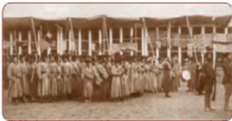
Buxoro harbiy qo‘shinlari