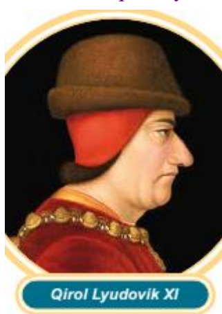
Qirol Lyudovik XI

Urush Fransiya iqtisodiyoti, xo‘jaligi va kishilar turmush tarziga jiddiy ziyon yetkazdi. Ko‘plab shahar va qishloqlar vayron bo‘lgan, savdo-sotiq, dehqonchilik va hunarmandchilik izdan chiqqan edi. Biroq dehqon va hunarmandlar tezda xo‘jalikni tiklashga harakat qildilar. Urush vaqtida tashlab qo‘yilgan yerlar ishga solinib, dehqonchilik yuksaldi, dehqonlar qo‘shni o‘lkalarga ham g‘alla sota boshladilar. Hunarmandlar ham ishlarini yo‘lga qo‘yib, mamlakatda temir eritish, mato to‘qish va boshqa ishlab chiqarish sohalari yanada rivojlandi. Viloyatlar o‘rtasida mehnat taqsimoti yanada kuchayishi savdo-sotiqning jonlanishiga sabab bo‘ldi. Xususan, Fransiya shimolidan janubga surp, jun, temir va tuz keltirilar, janubdan shimolga esa zaytun moyi, vino olib borib sotilar edi. Shuningdek, mamlakatda asta-sekin xalqaro savdo ham yuksalib bordi. Chunki Fransiyaning markazlashgan davlatga aylani shi mamlakat iqtisodiyotining ravnaq topishiga yordam berdi. Yuz yillik urush davrida Fransiyada