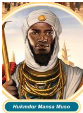
Hukmdor Mansa Muso