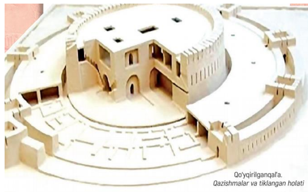
Qo‘yqirilgan qal‘a. Qazishmalar va tiklangan holati

Ahamoniylar davlatidan ajralib chiqib, mustaqil davlatga aylandi. Makedoniyalik Aleksandr hukmronligi davrida ham Xorazm davlati mustaqil edi. Qadimgi yunon tarixchisi Arrianning yozishicha, bu davrda Xorazmda Farasmanpodsholik qilgan. Mil. avv. IV–III asrlarda Xorazm O‘rta Osiyoda shaharsozlik va me‘morchilik keng rivojlangan muhim markaz ga aylanadi. Davlat chegaralarida hamda savdo yo‘llari bo‘ylab qal‘alar quriladi. Xorazmning Xiva, Jonbosqal‘a,