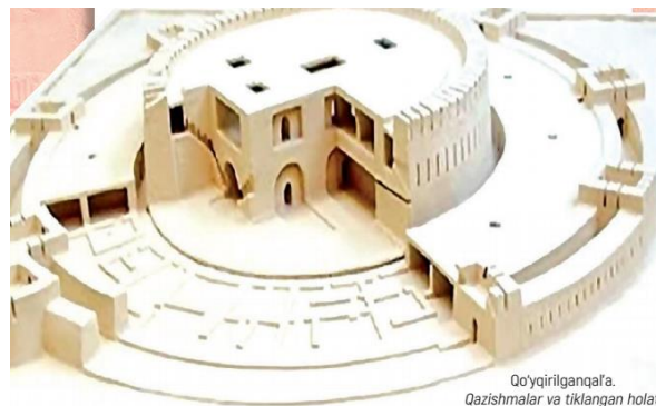
Qo‘yqirilgan qal‘a. Qazishmalar va tiklangan holati

Ahamoniylar davlatidan ajralib chiqib, mustaqil davlatga aylandi. Makedoniyalik Aleksandr hukmronligi davrida ham Xorazm davlati mustaqil edi. Qadimgi yunon tarixchisi Arrianning yozishicha, bu davrda Xorazmda Farasmanpodsholik qilgan. Mil. avv. IV–III asrlarda Xorazm O‘rta Osiyoda shaharsozlik va me‘morchilik keng rivojlangan muhim markaz ga aylanadi. Davlat chegaralarida hamda savdo yo‘llari bo‘ylab qal‘alar quriladi. Xorazmning Xiva, Jonbosqal‘a,