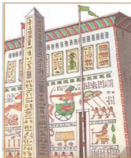
ibodatxona devorlari va ustuniga o‘yilgan yozuvlar

VI. Uyga vazifani e‘lon qilish: 1. Misrdagi eng mashhur piramidalar qayerda qurilgan?