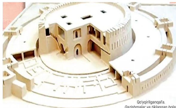
Qo‘yqirilgan qal‘a. Qazishmalar va tiklangan holati

Ahamoniylar davlatidan ajralib chiqib, mustaqil davlatga aylandi. Makedoniyalik Aleksandr hukmronligi davrida ham Xorazm davlati mustaqil edi. Qadimgi yunon tarixchisi Arrianning yozishicha, bu davrda Xorazmda Farasmanpodsholik qilgan. Mil. avv. IV–III asrlarda Xorazm O‘rta Osiyoda shaharsozlik va me‘morchilik keng rivojlangan muhim markaz ga aylanadi. Davlat chegaralarida hamda savdo yo‘llari bo‘ylab qal‘alar quriladi. Xorazmning Xiva, Jonbosqal‘a,