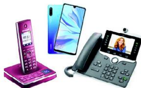
Zamonaviy telefon apparatlari

Telefonning yaratilishi va uning kishilar hayotida tutgan o‘rni haqida so‘zlab bering.