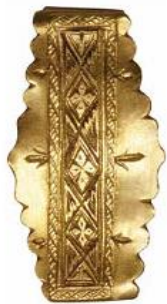
Oltin O‘rda davlatining oltin pullari va zargarlik buyumlari

Oltin O‘rda davlati Chingizxonning to‘ng‘ich o‘g‘li Jo‘ji ulusi hududida tashkil topgan. Chingizxon davlatni o‘g‘illari o‘rtasida taqsimlagan paytda Jo‘jiga eng katta hududlar berilib, u g‘arbda Irtish daryosidan sharqda Volgabo‘-yiga qadar cho‘zilib, Dashti Qipchoq, Shimoliy Xorazm, Amudaryo va Sirdaryoning quyi etaklarini o‘z ichiga olgan holda Jo‘ji ulusi tashkil topgan. Jo‘ji vafot et gach uning o‘g‘li Botuxon ulus yerlar ini kengaytirish maqsadida harbiy yurishlarni boshlab yuboradi. Botuxon 1237–1242-yillarda Rus va Sharqiy Yevropada juda katta istilolarni amalga oshiradi, xususan, Polsha, qisman Serbiya va Bolgariyani bo‘ysundiradi. Keyinchalik Chexiya va Vengriyaga ham bostirib kiradi. Shu tariqa katta hududlarni bosib olgan Botuxon XIII asrning 40-yillari boshi da Volga bulg‘orlari yurti, Dashti Qipchoq, Qrim, G‘arbiy Sibir hududlarini o‘z ichiga olgan Oltin O‘rda davlatiga asos soladi. Rus knyazlari Oltin O‘rdaga qaram bo‘lib, soliq to‘lab turadilar. Bu mamlakat rus manbalarida Oltin O‘rda, Sharq manbalarida esa Jo‘ji ulusideb atalgan. Oltin O‘rdani xon boshqargan. Xonlar faqat chingiziylar urug‘idan va Jo‘ji avlodlaridan bo‘lishi shart edi. Xonnisaylash masalasi zodagonlar yig‘ini – qurultoydahal etilgan. Saylangan xon oq kigizda ko‘tarilib, taxtga o‘tqizilgan, so‘ngra unga oltin qilich