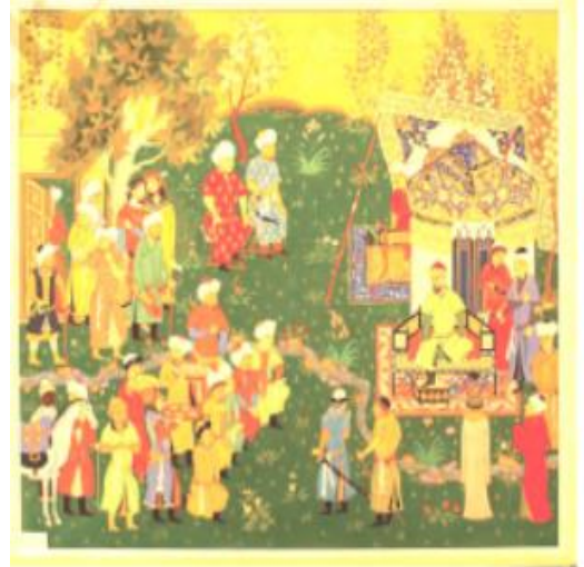
Elchilar qabuli. Miniatura

IV. Yangi mavzuni mustahkamlash: o‘quvchilardan mavzu bo‘yicha asosiy faktlar va voqealarni so‘rash, hujjat, surat yoki xarita asosida savollar berish.