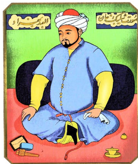
Muhammad Shayboniy portreti. Musavvir Kamoliddin Behzod (nusxasi)

VI. Uyga vazifani e‘lon qilish: yangi mavzuni to‘liq takrorlash va yangi mavzu yuzasidan bilimlarini mustahkamlab kelish.