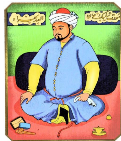
Muhammad Shayboniy portreti. Musavvir Kamoliddin Behzod (nusxasi)

IV. Yangi mavzuni mustahkamlash: o'quvchilardan mavzu bo'yicha asosiy faktlar va voqealarni so'rash, hujjat, surat yoki xarita asosida savollar berish.