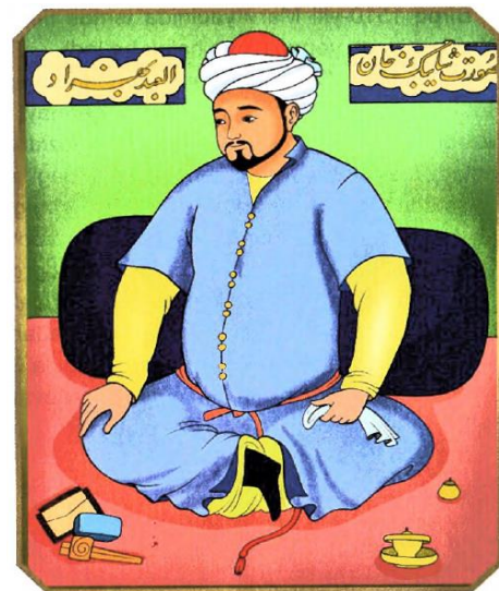
Muhammad Shayboniy portreti. Musavvir Kamoliddin Behzod (nusxasi)

VI. Uyg‘uz vazifani e‘lon qilish: yangi mavzuni to‘liq takrorlash va yangi mavzu yuzasidan bilimlarini mustahkamlab kelish.