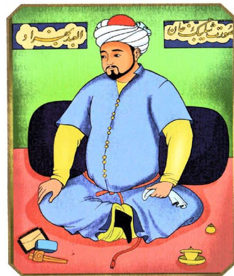
Muhammad Shayboniy portreti. Musavvir Kamoliddin Behzod (nusxasi)

VI. Uyg‘uz vazifani e‘lon qilish: yangi mavzuni to‘liq takrorlash va yangi mavzu yuzasidan bilimlarini mustahkamlab kelish.