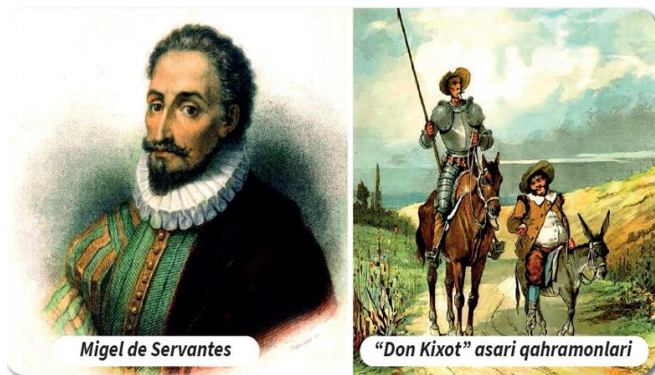
Migel de Servantes

VI. Uyga vazifani e‘lon qilish: yangi mavzuni to‘liq takrorlash va yangi mavzu yuzasidan bilimlarini mustahkamlab kelish.