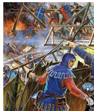
Yuz yillik urush davrida Fransiya xaritasi, 1435-yil Yuz yillik urush. Puatye jangi

harakatlarni amalga oshirib, fransuzlar flotini tor-mor keltirdi dengizda hukmron flotga aylandi. Shundan so‘ng ikki tomon quruqlikda 1346-yil Kresi yaqinida to‘qnashdilar. Urush fransuz ritsarlarining shijoati bilan boshlandi. Ritsarlar jangga o‘zlarining jangovar qobiliyatlarini namoyish qilish imkoniyati sifatida qaradilar. Biroq urushning asosiy janglarida ritsarlar emas, dehqonlardan iborat piyoda askarlar jasorat ko‘rsatdilar. Bu Yuz yillik urush tarixida muhim ahamiyatga ega bo‘ldi. Kresi jangida fransuz qo‘shinlari mag‘lubiyatga uchradi. Eduard III boshchiligidagi ingliz qo‘shini esa to‘la g‘alaba qozondi.