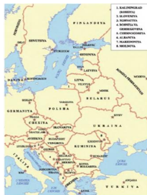
Sharqiy Yevropa mamlakatlari

VI. Uyga vazifani e‘lon qilish: yangi mavzuni to‘liq takrorlash va yangi mavzu yuzasidan bilimlarini mustahkamlab kelish.