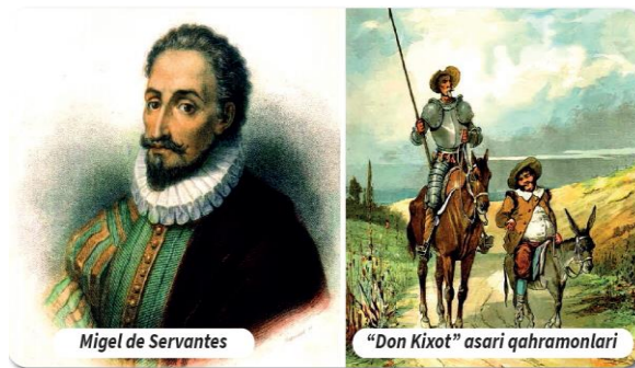
Migel de Servantes