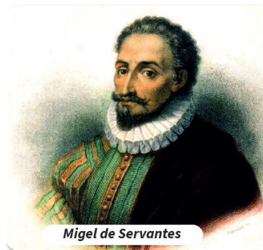
Miguel de Servantes