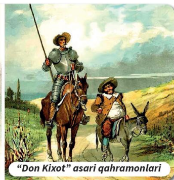
“Don Kixot” asari qahramonlari