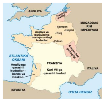
Yuz yillik urush davrida Fransiya xaritasi, 1435-yil