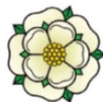
Yorklar xonadoni ramzi