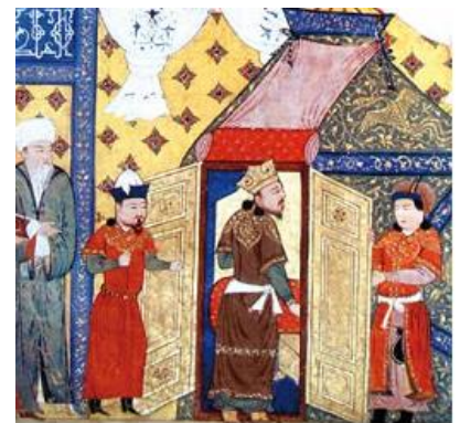
G'ozonxonning islom dinini qabul qilishi