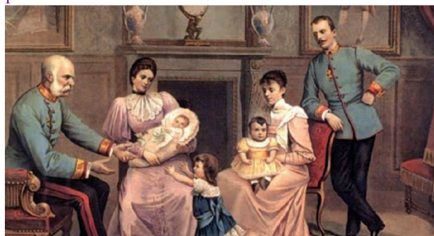
Avstriya-Vengriya imperatori Frans Iosif I va uning oilasi

III. Yangi mavzu bayoni: XIX asr oxirida Sharqiy Yevropaga Bolqon mamlakatlari, shuningdek, Avstriya-Vengriya va Rossiya imperiyalarining bir qismi kirardi. XIV–XV asrlarda Bolqon mamlakatlarida o‘rnatilgan Usmoniylar imperiyasi hukmronligi XIX asrgacha, ba’zi hududlarda XX asrgacha saqlanib qoldi. 1878-yili Rossiya yordamiga tayangan Serbiya o‘z mustaqilligini e’lon qildi. Shundan so‘ng Serbiya jadal rivojlandi va Rossiyaga yanada yaqinlashib bordi. Ammo aholisi serblardan iborat va Serbiya bilan birlashish azaliy orzusi bo‘lgan ikkita yirik viloyatlar – Bosniyava Gersegovina 1908-yili Avstriya tomonidan anneksiya qilindi. Avstriya-Vengriya imperiyasi 1867-yili ikki davlat – Avstriya va Vengriya hukmron doiralari kelishuvi asosida tashkil topgan edi.