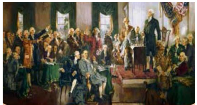
AQSH konstitutsiyasining qabul qilinishi

VI. Uyga vazifani e‘lon qilish: yangi mavzuni to‘liq takrorlash va yangi mavzu yuzasidan bilimlarini mustahkamlab kelish.