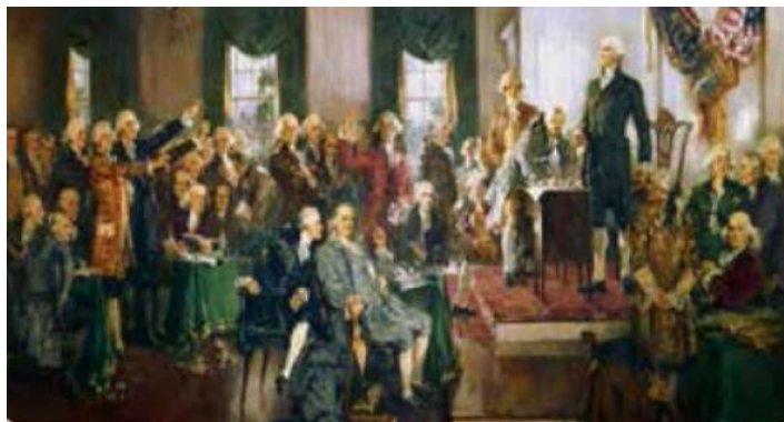
AQSH konstitutsiyasining qabul qilinishi

“Konstitutsiya” lotincha constitution so‘zidan olingan bo‘lib, tuzilish, tuzuk, belgilash, tartib o‘rnatish degan ma‘nolarni anglatadi. “Konstitutsiya” atamasi ilk bor Qadimgi Rim davlati qonunchiligida ishlatilgan. Konstitutsiya davlatning eng asosiy qonunlari jam bo‘lgan muhim hujjatdir. Bugungi zamonaviy demokratik davlatni asosiy qonun – konstitutsiyasiz tasavvur qilish juda mushkul. Konstitutsiya – insoniyatning jamiyat hayotini tartibga solishga qaratilgan eng muhim tarixiy kashfiyotlaridan biri sifatida hozirgi davrga qadar xizmat qilmoqda.