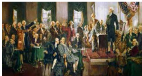
AQSH konstitutsiyasining qabul qilinishi

VI. Uyga vazifani e‘lon qilish: yangi mavzuni to‘liq takrorlash va yangi mavzu yuzasidan bilimlarini mustahkamlab kelish.