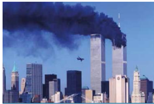
2001-yil 11-sentyabr kuni terroristlar qo‘lga olgan samolyotlar kelib urilishi natijasida portlagan Jahon savdo markazining egizak binolari

VI. Uyga vazifani e‘lon qilish: mavzuni to‘liq takrorlash va “Inson huquqlari va jamiyat manfaati o‘rtasidagi muvozanat” mavzusida qisqa insho yozib kelish.