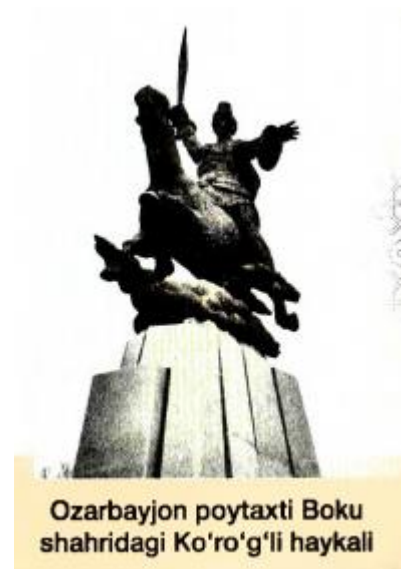
Ozarbayjon poytaxti Boku shahridagi Ko'ro'g'li haykali

V. Uyga vazifani e‘lon qilish: yangi mavzuni to‘liq takrorlash va yangi mavzu yuzasidan bilimlarini mustahkamlab kelish.