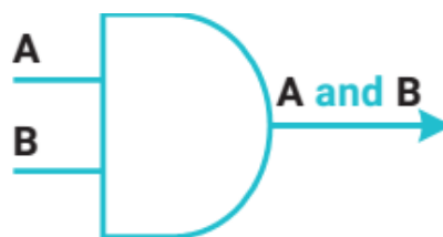
Рисунок 2. Элемент «AND»