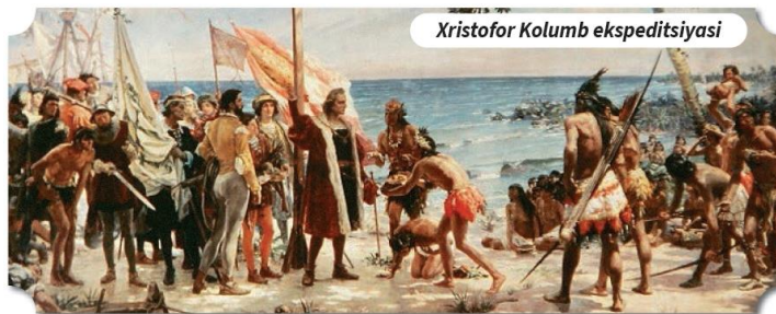
Xristofor Kolumb ekspeditsiyasi

Dunyoning barcha qismida katta o‘zgarishlar yuz berganiga qaramasdan, XV–XVII asrlarda yevropaliklar tomonidan yangi savdo yo‘llarining ochilishi tarixda Buyuk geografik kashfiyotlar nomini oldi. Zotan, aynan yevropaliklar tomonidan yangi savdo yo‘llarining ochilishi, kashf etilgan yerlarning o‘zlashtirilishi va u yerlardagi boyliklarning talanishi kapitalning dastlabki jamg‘arilishi jarayonini tezlashtirdi, mustamlaka tizimining shakllanishini boshlab berdi, jahon bozorining tarkib topishiga, Yevropada savdo kapitalining, bank ishi va kreditning rivojlanishiga olib keldi. Qit‘alar o‘rtasida iqtisodiy va madaniy aloqalar rivojlandi, jahon savdosi O‘rtayer dengizi (ayrim manbalarda O‘rta dengiz)dan Atlantika okeaniga ko‘chdi. Yevropaliklar Osiyoga O‘rtayer dengizi orqali o‘tadigan savdo yo‘llari, quruqlikdan o‘tuvchi karvon yo‘llari, jumladan, Buyuk Ipak yo‘li 1453-yili Konstantinopolni zabt etgan turklar tomonidan yopib qo‘yildi. Natijada Yevropa Sharqdan keladigan tovarlardan ajralib qoldi. Matolar, qand, bo‘yoqlar, murch, zanjabil, gullar va ziravorlar Yevropa bozorlariga qariyb kelmay qo‘ydi. Bu hol yevropaliklarni boy Sharq mamlakatlariga yangi yo‘llarni izlashga majbur qildi.