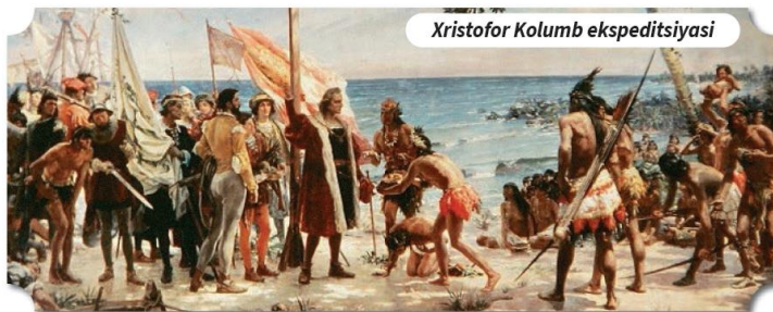
Xristofor Kolumb ekspeditsiyasi

Yevropaliklarning geografik kashfiyotlari. Dunyoning barcha qismida katta o‘zgarishlar yuz berganiga qaramasdan, XV–XVII asrlarda yevropaliklar tomonidan yangi savdo yo‘llarining ochilishi tarixda Buyuk geografik kashfiyotlar nomini oldi. Zotan, aynan yevropaliklar tomonidan yangi savdo yo‘llarining ochilishi, kashf etilgan yerlarning o‘zlashtirilishi va u yerlardagi boyliklarning talanishi kapitalning dastlabki jamg‘arilishi jarayonini tezlashtirdi, mustamlaka tizimining shakllanishini boshlab berdi, jahon bozorining tarkib topishiga, Yevropada savdo kapitalining, bank ishi va kreditning rivojlanishiga olib keldi. Qit‘alar o‘rtasida iqtisodiy va madaniy aloqalar rivojlandi, jahon savdosi O‘rtayer dengizi (ayrim manbalarda O‘rta dengiz)dan Atlantika okeaniga ko‘chdi. Yevropaliklar Osiyoga O‘rtayer dengizi orqali o‘tadigan savdo yo‘llari, quruqlikdan o‘tuvchi karvon yo‘llari, jumladan, Buyuk Ipak yo‘li 1453-yili Konstantinopolnizabt etgan turklar tomonidan yopib qo‘yildi. Natijada Yevropa Sharqdan keladigan tovarlardan ajralib qoldi. Matolar, qand, bo‘yoqlar, murch, zanjabil, gullar va ziravorlar Yevropa bozorlariga qariyb kelmay qo‘ydi. Bu hol yevropaliklarni boy Sharq mamlakatlariga yangi yo‘llarni izlashga majbur qildi.