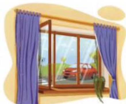
Автомобиль проехал за окном