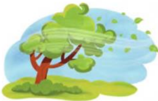
Ветер раскачивает деревья