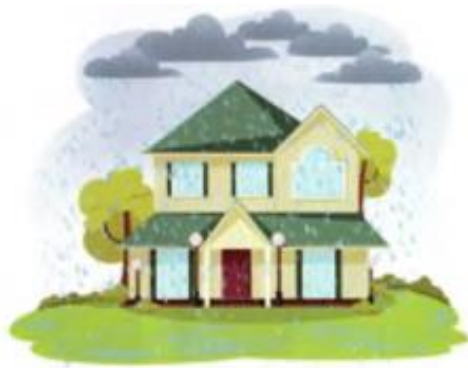
Дождь стучит по крыше