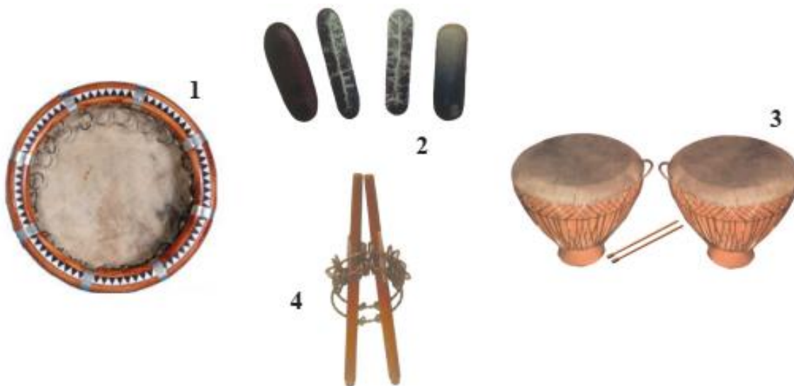
1. Дойра. 2. Кайрак. 3. Нагора. 4. Сафоил.

Например, в произведениях, исполняемых на свадьбах, будет звучать – нагора, в песнях – дойра, в хорезмских танцах – кайрак, в уйгурских мелодиях – сафоил, это уместно, потому что звучание будет гораздо насыщеннее. Европейские музыкальные инструменты, также обогащают звучание музыки