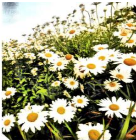
Роза и ромашка – цветковые растения. Они размножаются семенами.