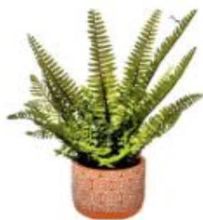
Папоротник – споровое растение. Папоротники размножаются с помощью спор.