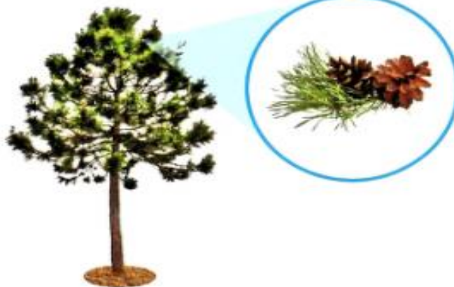
Сосна – хвойное растение. Хвойные растения размножаются семенами.