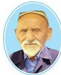
Ризамат-ота Мусамухамедов (1881–1979)