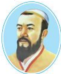
Ажинияз Косыбайулы (1824–1878)