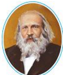
Дмитрий Менделеев (1834–1907)