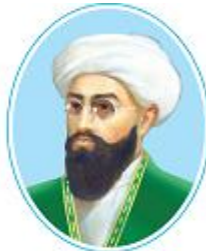
Махмудходжа Бехбуди (1875–1919)