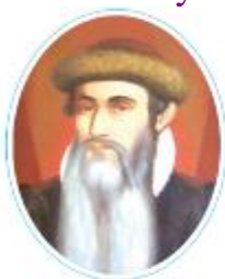
Иоганн Гутенберг (1400–1468)