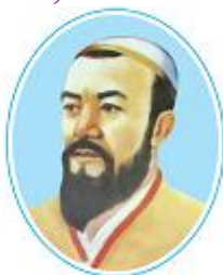
Ажинияз Косыбайулы (1824–1878)