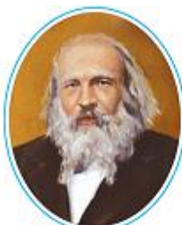
Дмитрий Менделеев (1834–1907)