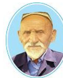
Ризамат-ота Мусамухамедов (1881–1979)