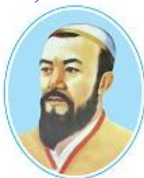
Ажинияз Косыбайулы (1824–1878)