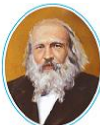
Дмитрий Менделеев (1834–1907)