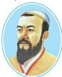
Ажинияз Косыбайулы (1824–1878)