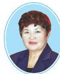
Вера Пак (1938–2018)

Приведите примеры деятельности людей, изображенных на фотографиях выше. Почему имена некоторых людей помнят веками? Каких людей забывают быстро? В народе человека, оставившего о себе доброе имя, сравнивают с садовником. С кем еще можно сравнить хорошего человека?