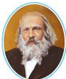
Дмитрий Менделеев (1834–1907)