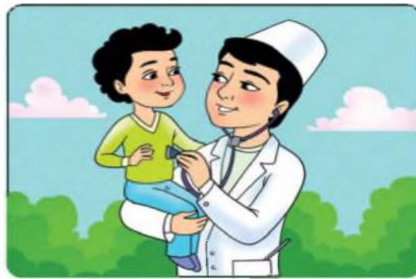
Право на получение медицинской помощи.