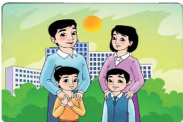
Право на семью.

Узбекистан присоединился к этой Конвенции 9 декабря 1992 года. Конвенция состоит из 54 статей. Важную роль в решении проблем детей на международном уровне играет ЮНИСЕФ (UNICEF) - Детский фонд ООН. ЮНИСЕФ помогает детям и женщинам, пострадавшим от войн, гражданских беспорядков и стихийных бедствий, поставляя необходимое для жизни в зоны чрезвычайных ситуаций. Для решения особых проблем, возникающих в связи с военными действиями, ЮНИСЕФ организует оказание помощи детям по обеим сторонам конфликта. Более 70 лет ЮНИСЕФ помогает детям. Вот некоторые права, приведённые в Конвенции: