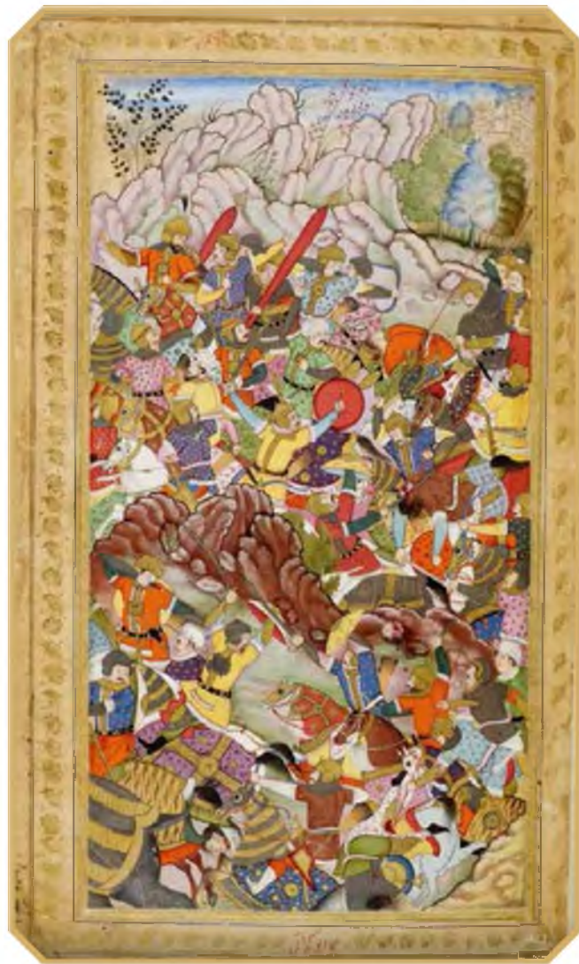
"Boburnoma"ga ishlangan miniatyura

Zahiriddin Muhammad Boburning "Boburnoma" asaridan