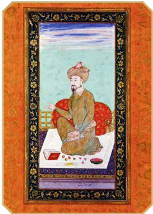
Bobur portreti (nusxasi)

Bobur 200–300 navkari bilan Hisor tog'lari orqali Afg'onistonga o'tadi va u yerdagi ichki nizolardan foydalanib G'azna va Kobulni egallaydi. Kobulni egallagach, mustaqil davlat tuzishga jadal kirishadi. Qo'shinni tartibga keltiradi va qattiq ichki intizom o'rnatadi.